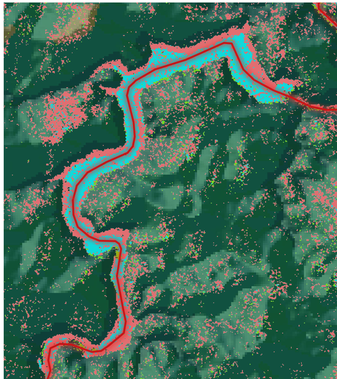
Barrage sur la rivière Doce (1:25000)

Code couleur: Bleu: pas de changement, Rouge: accumulation d'eau, Vert: perte d'eau